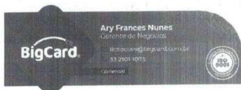
image001.jpg ~72 KB

Compras e Licitações - Prefeitura Municipal de Frei Inocência/MG